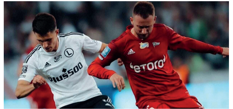
Fot. z meczu Legia Warszawa - Lechia Gdańsk