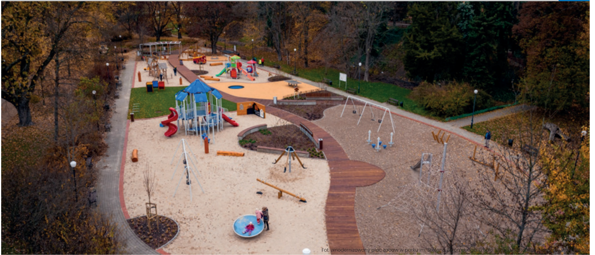
Fot. zmodernizowany plac zabaw w parku im. Stefana Żeromskiego.