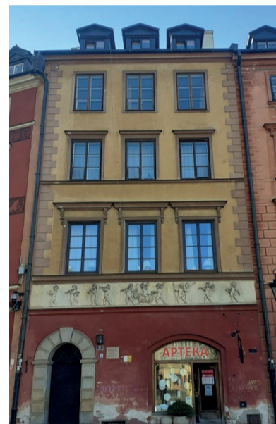
Fot. kamienica zlokalizowana przy Rynku Starego Miasta 17, źródło: UM Warszawa

wspólnota mieszkaniowa, która otrzymała na ten cel dotację ze strony m.st. Warszawy w wysokości 175 tys. zł.