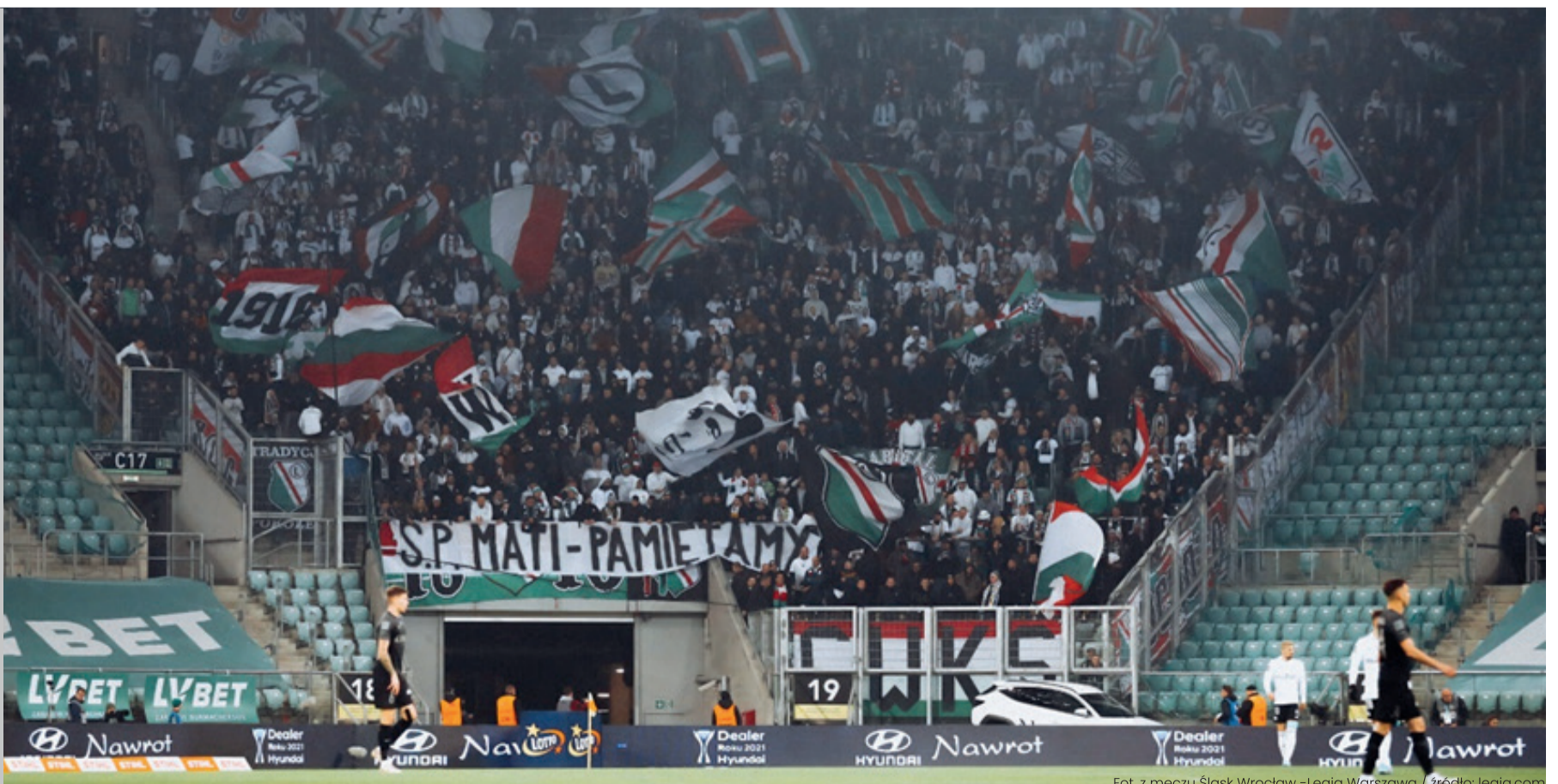
Fot. z meczu Śląsk Wrocław - Legia Warszawa / źródło: legia.com

Miejsce na reklamę w miesięczniku Nasza Warszawa Oferujemy możliwość odpłatnego opublikowania na łamach gazety Nasza Warszawa (portalu internetowego oraz mediów społecznościowych) artykułów, ogłoszeń lub reklam Masz pytania? Napisz: biuro@naszemiasto.info