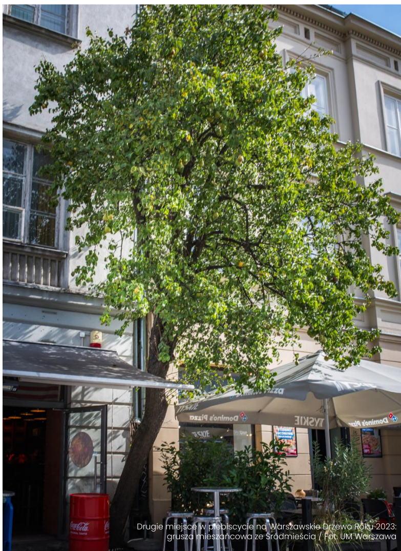
Drugie miejsce w plebiscycie na Warszawskie Drzewo Roku 2023: grusza mieszańcowa ze Śródmieścia