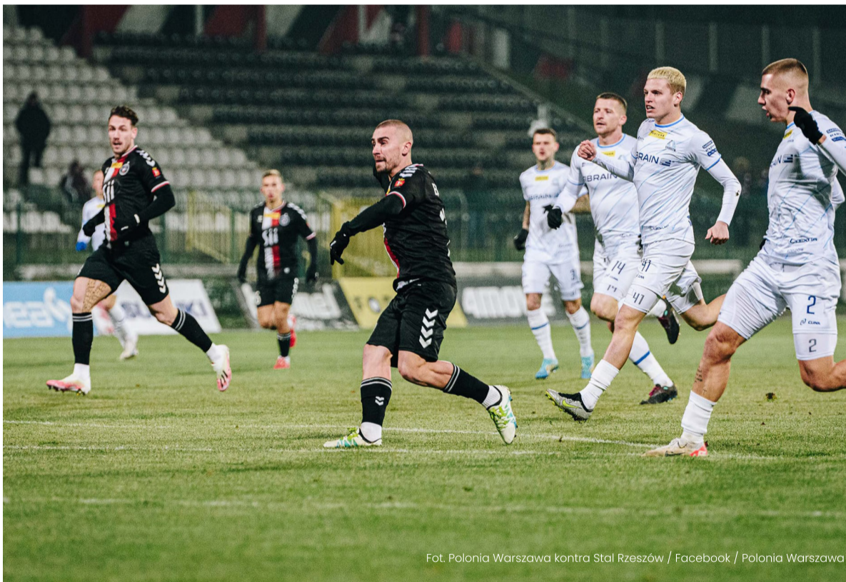
Fot. Polonia Warszawa kontra Stal Rzeszów / Facebook / Polonia Warszawa