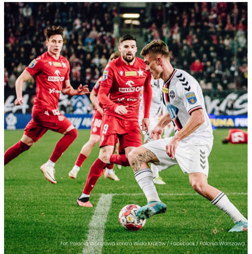
Fot. Polonia Warszawa kontra Wisła Kraków / Facebook / Polonia Warszawa