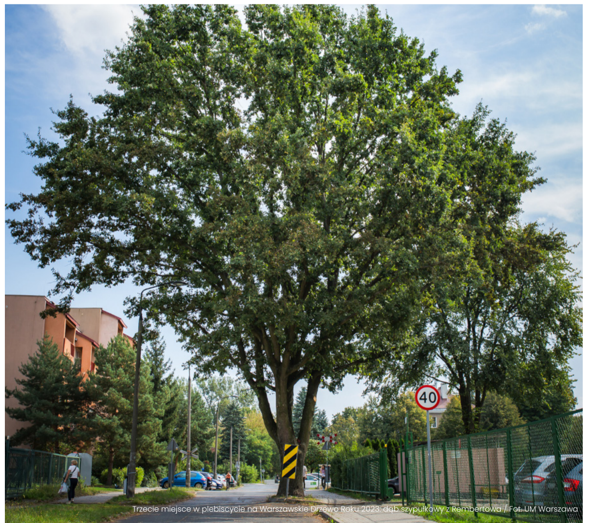
Trzecie miejsce w plebiscycie na Warszawskie Drzewo Roku 2023: dąb szypułkowy z Rembertowa