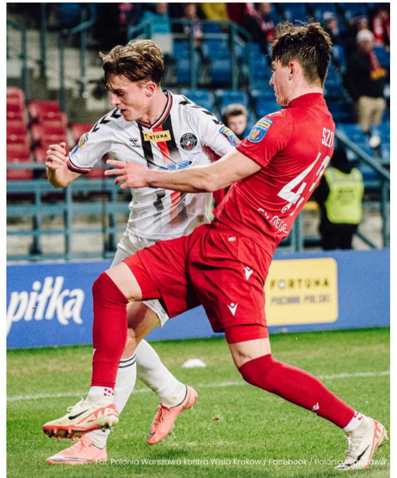
Fot. Polonia Warszawa kontra Wisła Kraków / Facebook / Polonia Warszawa