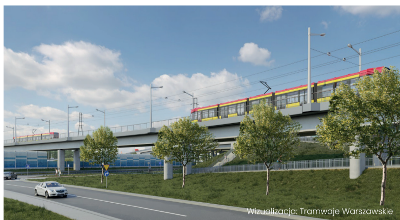
Wizualizacja: Tramwaje Warszawskie

„Tramwaj na Zieloną Białołąkę pozwoli mieszkańcom osiedli wschodniej Białołąki szybko dojechać do najbliższej stacji metra przy Kondratowicza. Nowy odcinek sieci tramwajowej o długości ok. 6,5 km rozpocznie się w obszarze skrzyżowania ulic Matki Teresy z Kaluty oraz Rembielińskiej,