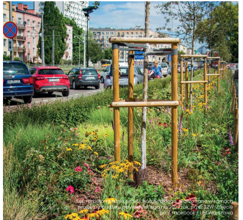
Fot. rozbetonowanie przy ul. Korotyńskiego realizowane w ramach projektu z budżetu obywatelskiego na 2022 rok, przez ZZW. Zdjęcie po