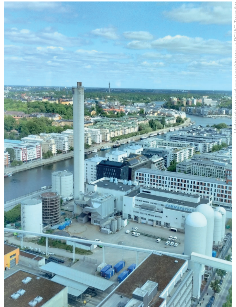
Material powstał we współpracy z PGNiG Termika

W ramach prac nad projektem pomp ciepła PGNiG TERMIKA została zaproszona przez Siemens Energy do Sztokholmu, gdzie razem z przedstawicielami firmy Ramboll – wykonawcy studium