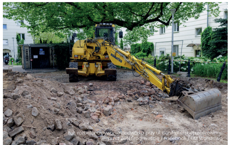
Fot. rozbetonowywanie podwórka przy ul. Bonifraterskiej realizowane przez ZGN Śródmieście