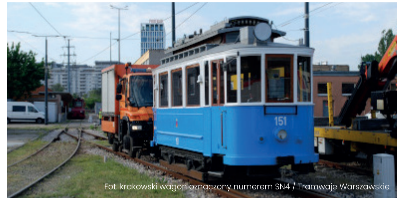
Fot. krakowski wagon oznaczony numerem SN4 / Tramwaje Warszawskie