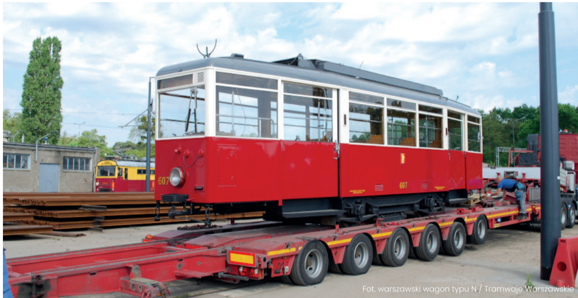
Fot. warszawski wagon typu N / Tramwaje Warszawskie

ciu trasy W-Z 22 lipca 1949 roku. Służył podróżnym także w Szczecinie, a w latach 90. – po remoncie w Krakowie – wrócił do stolicy” – informuje UM Warszawa.