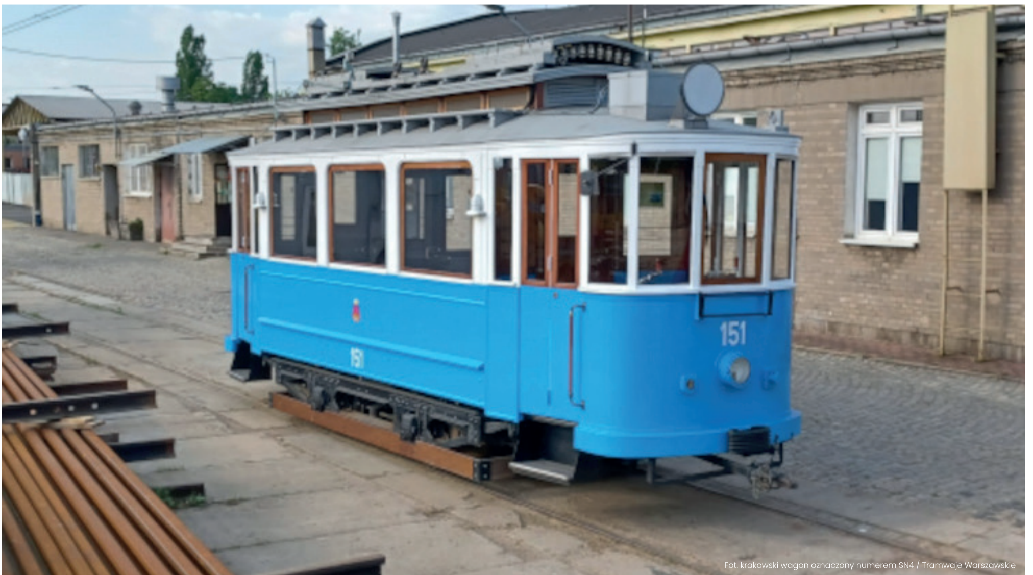
Fot. krakowski wagon oznaczony numerem SN4 / Tramwaje Warszawskie