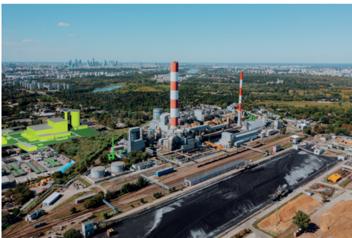
Fot. Kolorem jasnozielonym zaznaczono wizualizację przyszłego bloku gazowo-parowego w Ec Siekierki